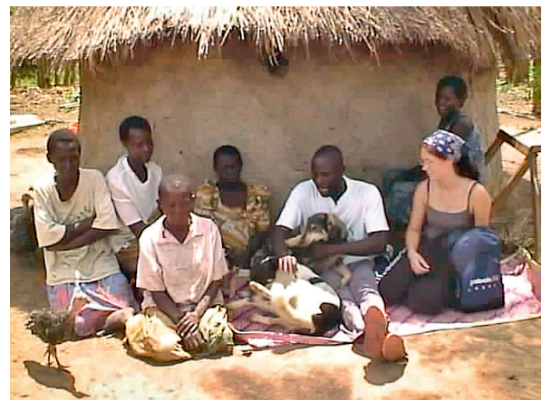
Maja rakennetaan oksista pujottelemalla valmistetun kehikon varaan. Kehikko muurataan savella pyöreäksi torniksi. Katto ladotaan heinistä. Lattia on kovaksi tallattua maata tai sementtiä.

päästä opiskelemaan Kampalaan. Olisi mahtavaa olla opettaja tai rakennusmies. Opettaisın lapsia ja kulkisin hienoissa vaatteissa tai sitten osaisin rakentaa taloja. Rakentaisin ison talon