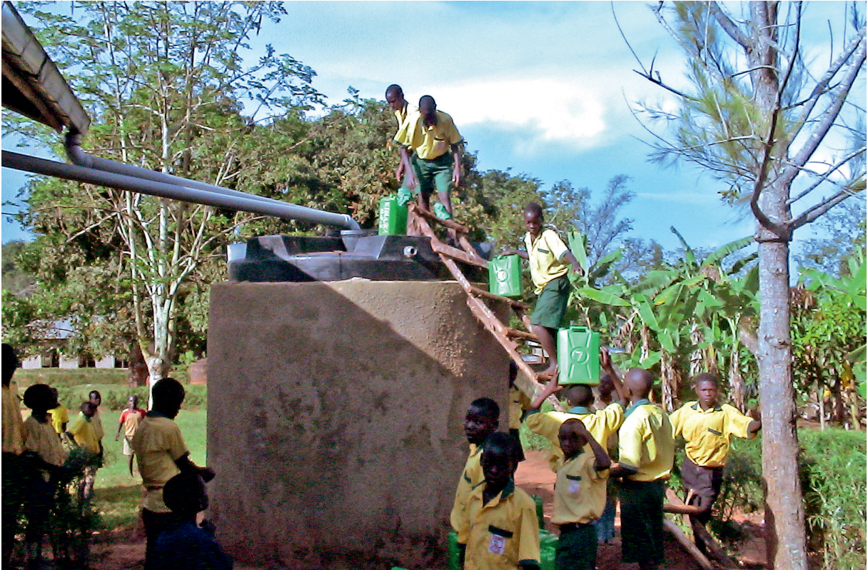
Koulun juomavettä kerätään sadeaikana vesisäiliöön talteen, mutta kuivaan aikaan vanhemmat oppilaat kantavat sitä kaivolta.

lä kello 16:een saakka, ja sen jälkeen palaamme takaisin kotiin. Kuivaan aikaan tie on hyvin pölyinen ja sateella se on liukas ja mutainen.