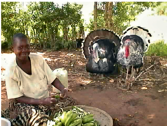
Vincentin kotona on kanoja ja kalkkunoita.

Vanhimmat siskot jäävät kotiin auttamaan äitejään. Kouluun on matkaa 4 kilometriä, ja monet kavereistani asuvat saman matkan varrella. He odottavat meitä tien laidassa ja liittyvät seuraam-