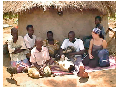
Maja rakennetaan oksista pujottelemalla valmistetun kehikon varaan. Kehikko muurataan savella pyöreäksi torniksi. Katto ladotaan heinistä. Lattia on kovaksi tallattua maata tai sementtiä.

päästä opiskelemaan Kampalaan. Olisi mahtavaa olla opettaja tai rakennusmies. Opettaisın lapsia ja kulkisin hienoissa vaatteissa tai sitten osaisin rakentaa taloja. Rakentaisin ison talon