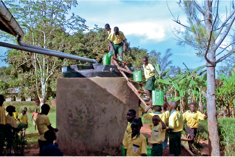
Koulun juomavettä kerätään sadeaikana vesisäiliöön talteen, mutta kuivaan aikaan vanhemmat oppilaat kantavat sitä kaivolta.

lä kello 16:een saakka, ja sen jälkeen palaamme takaisin kotiin. Kuivaan aikaan tie on hyvin pölyinen ja sateella se on liukas ja mutainen.