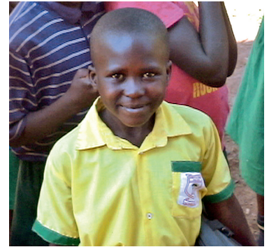
Ugandassa koululaisilla on koulupuvut. Kibuukan koululla kaikki oppilaat pukeutuvat keltaiseen kauluspaitaan ja vihreisiin housuihin tai hameeseen.

Ruokatunnin jälkeen leikimme kaverien kanssa hippaa tai olemme pi-